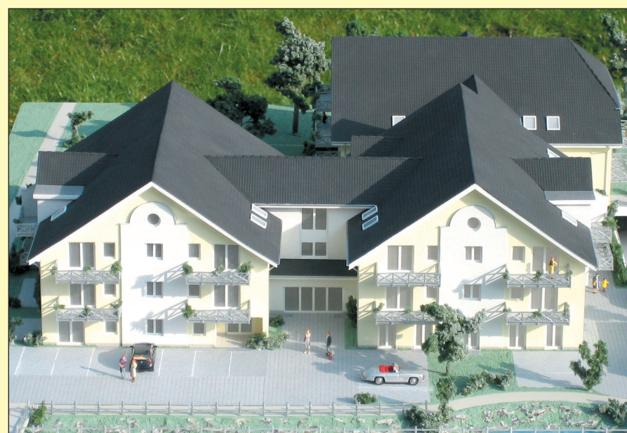
Noch ist erst das Modell der Service-Wohnanlage komplett fertig, jedoch werden die Restarbeiten am Objekt bis Ende März abgeschlossen sein, sodass am 1. April der Erstbezug erfolgen kann.

„Wir sind ganz sicher“, sagt Bernd Krähling, „dass unser Haus das Heilbad verschönern und aufwerten wird. Viele nette Leute jenseits der 50 werden als neue Bür-