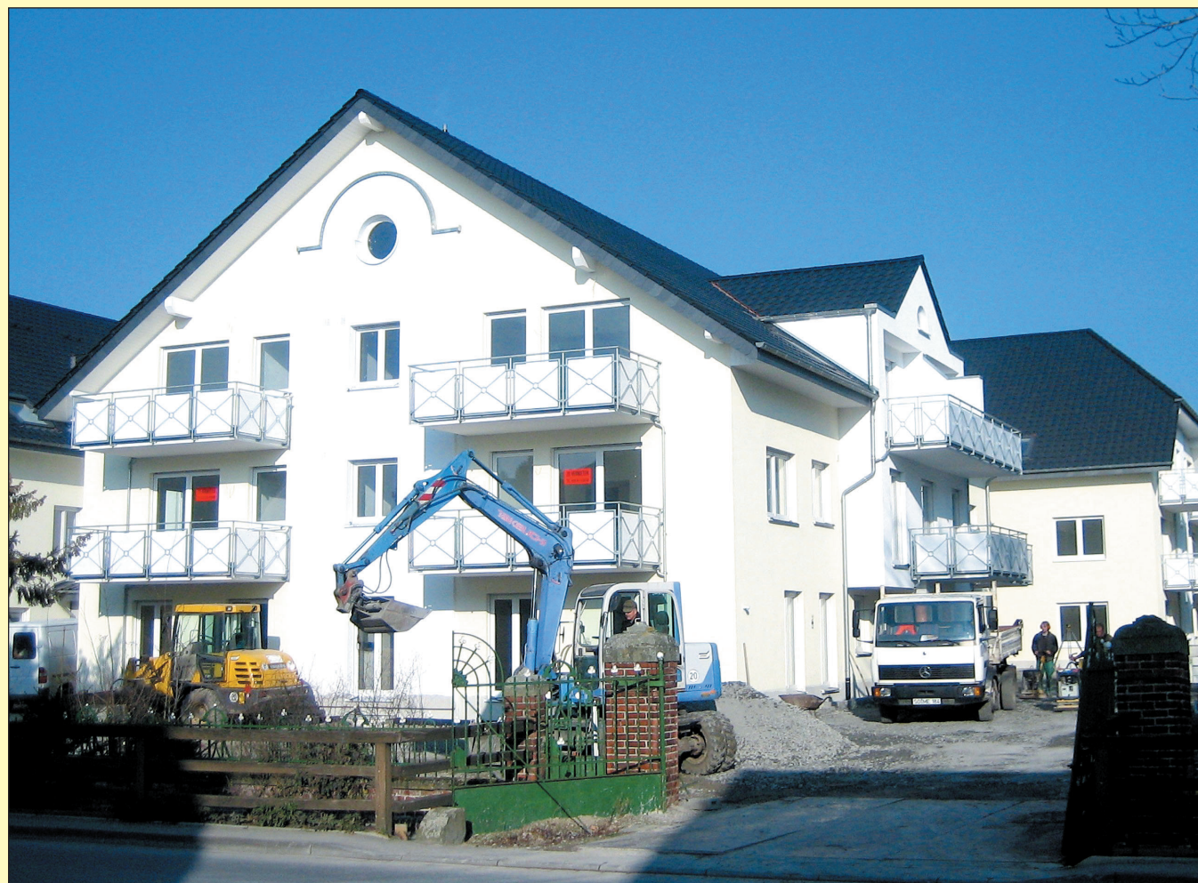
Die restlichen Arbeiten zur Realisierung der Service-Wohnanlage laufen auf Hochtouren. Alle Beteiligten freuen sich darauf, dass am 1. April die ersten Bewohner einziehen.

Fassadengestaltung Wohnraumgestaltung Aussenputz Innenputz